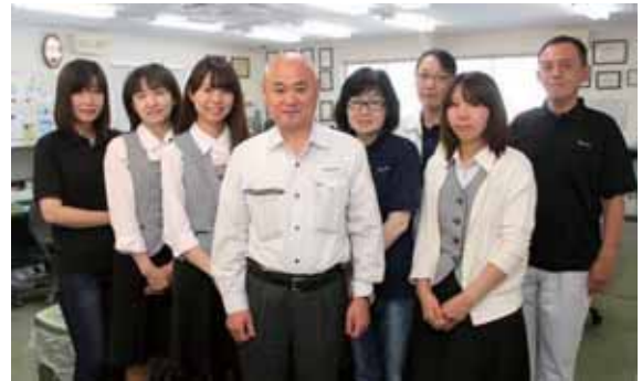
現在社員は19名。うち管理系の5名と現場監督6名が主に「アイキューブ本家シリーズ」を使用している。

まに作成できる帳票出力で現場と管理部門の間のチェックも確実になりました。特に自由帳票作成は、細かな条件設定ができる上によく使う設定はメモリ登録できるので大変便利です。まだまだ使いこなせていない機能も多いと思いますが、そんなときはアイキューブさんにすぐ電話をして確認します。サポート対応も丁寧なので大助かりですね。